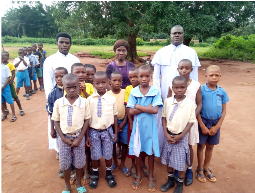
Schüler und Lehrer

Sehen wir in diesen Kindern die Sonne! Sehen wir in den Schülerinnen und Schülern Weisheit und Stärke!