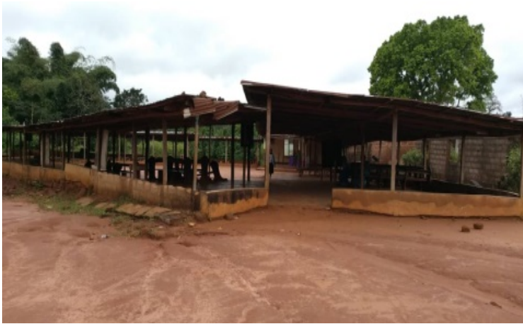
Das aktuelle Schulgebäude

Die Bildungsstätten sind selbst für die primitivsten Verhältnisse Afrikas unzumutbar.