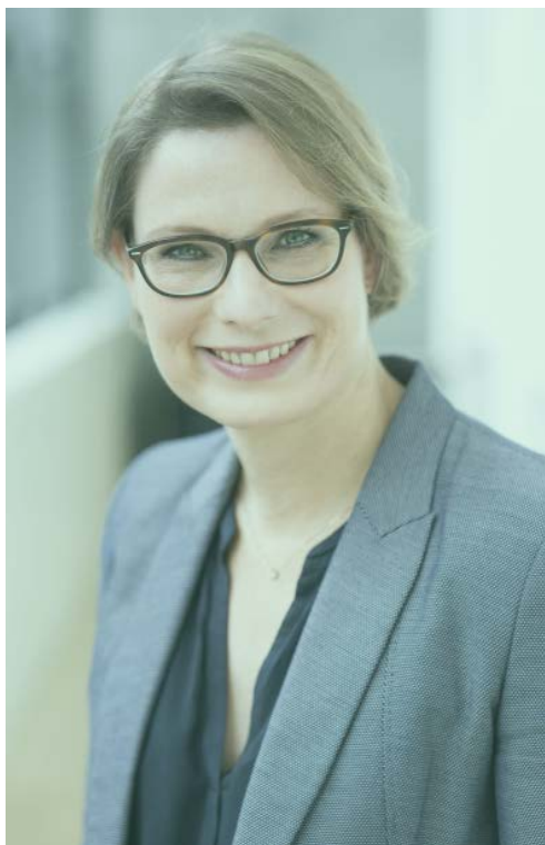
Frau Dr. Stefanie Hubig Ministerin für Bildung des Bundeslandes Rheinland-Pfalz

Liebe Mitglieder der katholischen Pfarreiengemeinschaft Koblenz-Innenstadt,